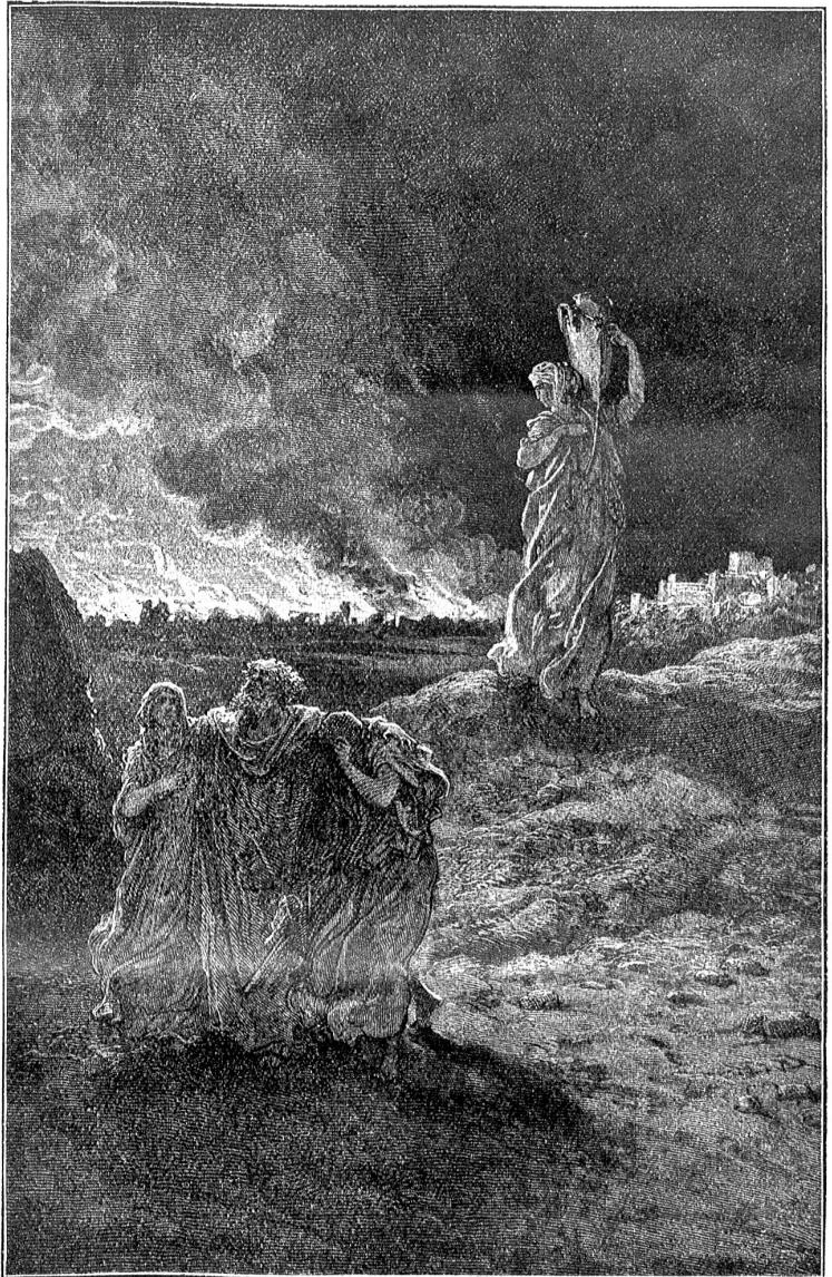
Untergang Gomorras, Lots Errettung, Lots Weib zur Salzsäule erstarrt.

Tante Meieli war indessen ihrer Gewohnheit gemäß herumgetrippelt und hatte ein paar Schubladen aufgerissen, um darin irgend etwas zu finden, womit sie Susanna erfreuen konnte. Sie brachte dem schweigenden Mädchen endlich eine runde Schachtel, die innen mit Schilddrot ausgefüllt war und deren Deckel das Bild einer hübschen Rokokodame zeigte, die sich, wenn man auf einen Knopf drückte, einen Fächer vors Gesicht hielt.