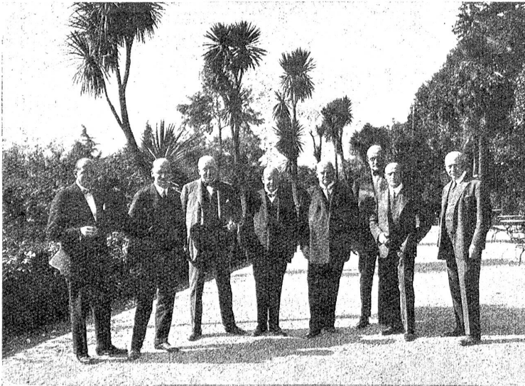
Die Konferenz in Locarno.