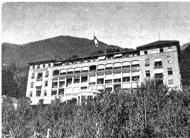
Die Konferenz in Locarno.

Hotel Eiplanade in Locarno, das Quartier der deutschen Delegation.