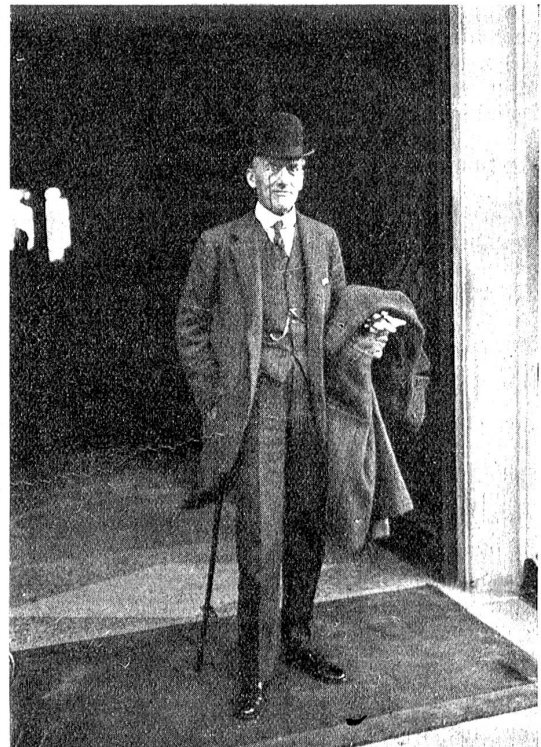
Die Konferenz in Locarno. Der englische Aussenminister Austen Chamberlain.

Wer sich die Mühe nimmt, sich durch den Wust der belanglosen Nachrichten hindurch zu lesen, der kößt immer-