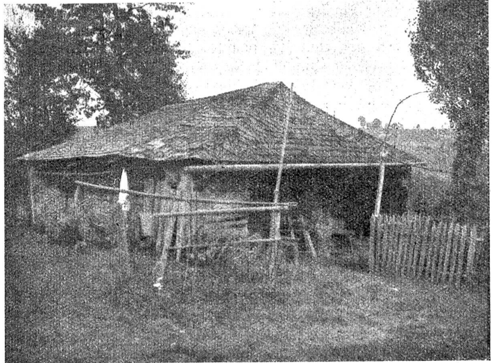
Das Häuschen eines Chachelhefter

Fünfunddreißig Jahre später! Der Alte ist längst gestorben und mit ihm wohl auch der letzte Häftlimacher. In der Gegend, da er wohnte, habe ich für Sommer und Herbst das Häuschen eines Geißebäuerleins gemietet; denn im Sommer ist er auf seiner Geißenalp, und sein Häuschen im Tale unten, immerhin in 900 Meter Höhe, steht leer.