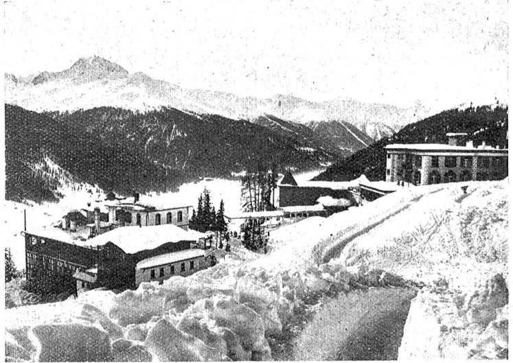
Winter in den Bergen. — Davos-Platz, der weltberühmte Kurort für Lungenkranke, liegt in prachtvollem Winterschmuck.

Bundespräsident Häberlin ist heimatberechtigt in Biffegg und Frauenfeld; er wurde am 6. September 1868 in Weinfelden geboren, studierte in Zürich, Leipzig und Berlin Jurisprudenz und übernahm 1892 ein Anwaltsbureau in Weinfelden. 1894 übersiedelte er nach Frauenfeld. 1899 wurde er Präsident des dortigen Bezirksgerichtes, 1904 kam er in den Nationalrat, 1918/19 präsidierte er den letzten Majorz-Nationalrat und 1920 wurde er als Nachfolger des zurückgetretenen S. Calonder zum Bundesrat gewählt. Beim Militär bekleidet er den Rang eines Obersten der Infanterie. In Frauenfeld wurde seine Wahl zum Bundespräsidenten mit 22 Kanonenschüssen begrüßt, eine besondere