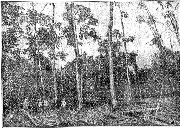
Balsabäume in Ecuador.

besitzt. Während ein zylindrisches Stück Balsaholz von 14,8 Zentimeter Höhe und 11,1 Zentimeter Durchmesser 220 Gramm wiegt, ist ein gleich großes Stück Kork 310 Gramm