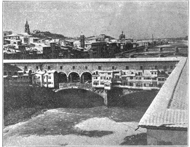
Abnorme Kälte und Schnee in Italien (vor ca. 14 Tagen). In Florenz hat die Kälte acht Grad unter Null erreicht. Das Bild zeigt einen Überblick über die „Ponte Vecchio“ und den zugefrorenen Arno.

Mehr als wir Schweizer trägt der Deutsche in sich die Sehnsucht nach dem Lande Taffos und Dante Alighieris.