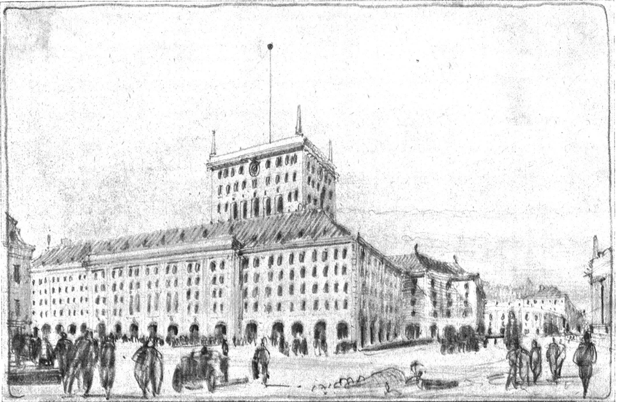
Neuer Bahnhof Bern. — Projekt Liechty b. Perspektivische Skizze.

Erstellungskosten des Bahnhofgebäudes rund 2,500,000 Franken; Erstellungskosten des Geschäftshauses nach Projekt (a) rund Fr. 2,500,000; Erstellungskosten des Geschäftshauses nach Projekt (b) rund Fr. 8,000,000.