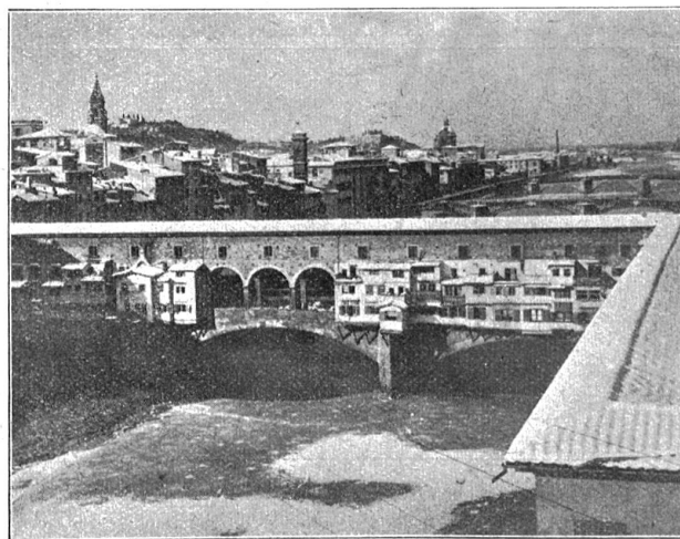
Abnorme Kälte und Schnee in Italien (vor ca. 14 Tagen). In Florenz hat die Kälte acht Grad unter Null erreicht. Das Bild zeigt einen Überblick über die „Ponte Vecchio“ und den zugefrorenen Arno.

Mehr als wir Schweizer trägt der Deutsche in sich die Sehnsucht nach dem Lande Taffos und Dante Alighieris.