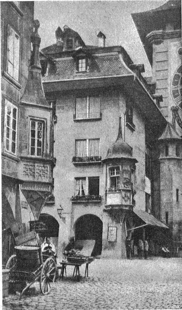
Die Erker beim Zeitglockenturm und an der Ecke Kramgasse-Hotelgasse.

darauf fühlte, daß dies in der Tat bitterer Ernst war, fing er heftig zu weinen an. Er hörte es nicht, als die Stubentür ging und schien nicht zu bemerken, daß sie eintrat, um die seine Tränen flossen. Den Kopf in seinen Armkreis auf den Tisch gelegt — so weinte er wie ein Kind, dem ein heiß Begehren versagt wird.