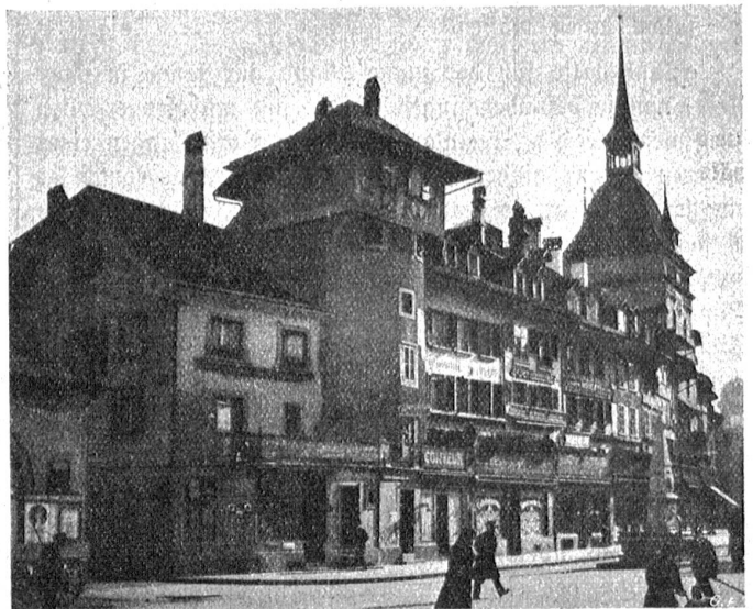
Der Holländerturm am Waisenhausplatz

Die untenstehende Abbildung zeigt den sogenannten Holländerturm am Waisenhausplatz. Er stellt einen letzten Rest der zweiten Befestigungslinie dar, die die unter der Herrschaft Peters von Savoyen (zirka 1256) entstandene erste Stadterweiterung abschloß, ist also zweifellos eines