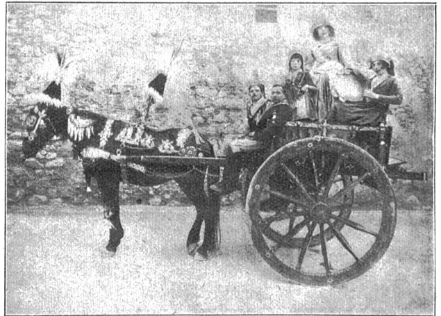
Sizilianische Familie auf ihrem typischen Karren, der in der Woche zur Arbeit und Sonntags zur Ausfahrt benützt wird.

Just Hartmann wurde wieder in die Schule aufgenommen und bestand ein glänzendes Examen. Zu Klagen gab er nie mehr Anlaß.