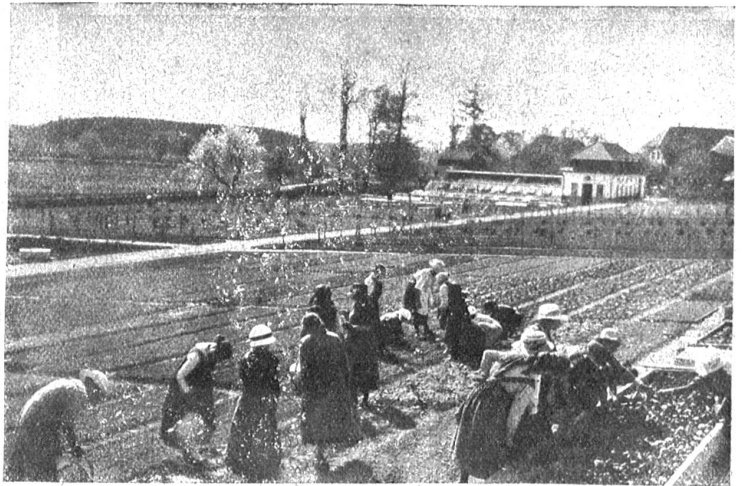
Gemüsebaukurs für Frauen und Töchter.

seiner intensiven Farbenpracht aus. Dann schweift der Blick weiter und entdeckt wohlgeordnete Anlagen, in denen die verschiedensten Arten Gemüse gepflanzt werden. Und weiter sieht man lange Reihen junger Obstbäume, die in die mannigfaltigsten Formen geschnitten wurden. Dann kommen die Medizinalpflanzen. Welche Menge Kräuter läßt die Natur zum Wohle der leidenden Kreatur, sei es Mensch oder Tier, gedeihen. Gegen 100 Sorten werden gezogen. Sie sind der Sammelplatz vieler hunderter Bienen, die sich summend und brummend in dem Gestäude herumtummeln. Und weiter kommen Giftpflanzen, von denen wir nur einen Teil kennen. Und dann weitet sich der Garten wieder für Obstbäume, Spaliere, Gemüsepflanzungen. In einem Treibhaus gedeihen tropische Pflanzen und Gewächse, wie sie in unsern großen botanischen Gärten zu sehen sind. Der landwirtschaftliche Betrieb des Deschberges umfaßt noch mehr Obstbäume, an denen verschiedenartige Versuche, die der Hebung des Obstbaues gelten, gemacht werden. Er schließt auch Viehhaltung in sich.