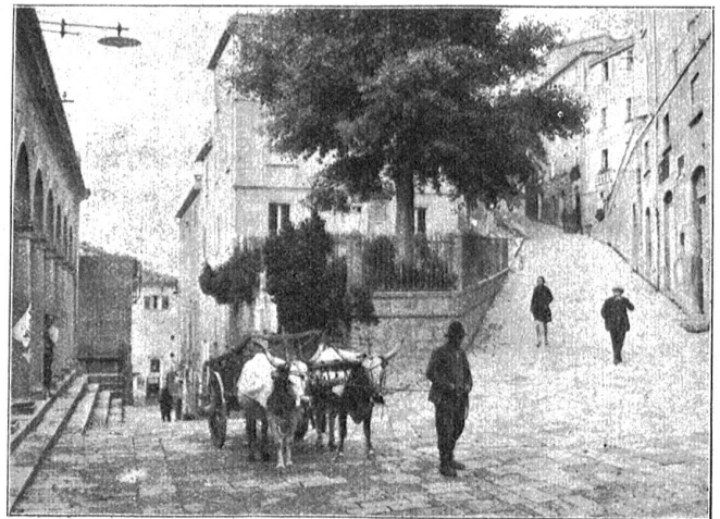
Charakteristisches Straßenbild aus San Marino.

In Mittelitalien, an einem Ausläufer des Apennin, in der Nähe von Rimini liegt San Marino, eine Miniaturrepublik, die das kleinste Staatswesen der Welt darstellt. Um das schon 885 genannte Kloster San Marino sammelte sich eine Dorfbevölkerung, die ihr bürgerliches Gemeinwesen nach jenem Kloster oder Schutzheiligen taufte. Durch Kauf und auch mit den Waffen erweiterten die Bürger von San Marino in der Folgezeit ihr Gebiet. Oft hatte die kleine Republik furchtbar zu leiden unter den blutigen Kriegszügen und Aufständen des Mittelalters, wobei sie mehr als einmal, freilich jedesmal nur für kurze Zeit, die Freiheit und Selbstständigkeit verlor. Eine Bulle (päpstlicher Erlass) des Papstes Pius VII., 1817, welche die Freiheit der Republik aufs neue bestätigte, stellte San Marino in Marmor eingegraben an der Grenze auf und durch Konventionen von 1862, 1872 und 1897 hat sich der Kleinstaat bis auf den heutigen Tag unter den Schutz des Königs von Italien gestellt. Die Grundgesetze des Staates reichen in das 13. Jahrhundert hinauf. An Stelle der ursprünglichen Demokratie trat später als Leiter des Gemeinwesens und Vertreter nach außen der Große Rat, der aus 60 zu gleichen Teilen aus dem Adel, den Bürgern der Hauptstadt und den übrigen Bewohnern des Landes gewählten Ältesten besteht. Aus diesen 60 Mitgliedern, die auf Lebenszeit gewählt werden, wird jährlich als höchste Behörde der Rat der Zwölf gewählt, aus dessen Mitte zwei Regenten zur