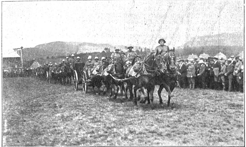
Vom Schweizerischen Artillerietag in Bern (30. Mai 1926).

Betreffs Unterstützung von Bedürftigen, die in mehreren Kantonen Bürgerrecht besitzen, haben sich die Kantone Luzern, Schwyz, Obwalden, Zug, Freiburg, Baselstadt, Baselland, Schaff-