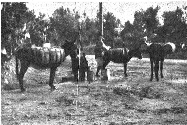
Wasserverkäufer von Sidi Bou Saïd.

Von dem Garten des arabischen Hauses, welches ich bewohne, hat man eine wunderbare Fernsicht auf das Meer. Stundenlang kann ich dort sitzen und ins Weite schauen.