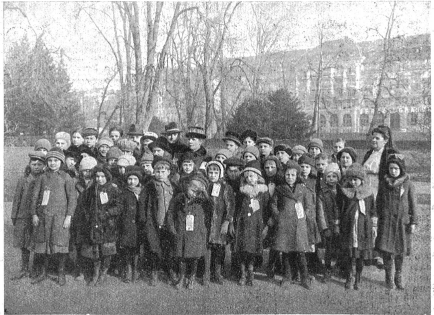
Die ersten Ungarkinder bei ihrer Ankunft in Zürich (Februar 1920).

Morgen Sonntag werden sich in Bümpliz die Nationalturner des Kantons Bern zum Wettkampf zusammenfinden. Es sind über 300 angemeldet, unter denen sich altbewährte Kämpfer befinden, die schon mit Erfolg an eidgenössischen Turnfesten mitgemacht haben. Die Wettkämpfer in Bümpliz verdienen deshalb großes Interesse.