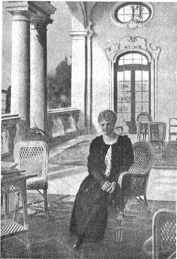
† Königin Mutter Margherita von Italien.

habe seit 1876 auf die neue in ihrem Anfang erreichte zwischenstaatliche Schiedsgerichtsbarkeit hingearbeitet und lade nun alle Nationen, klein und groß, zum Frieden ein.