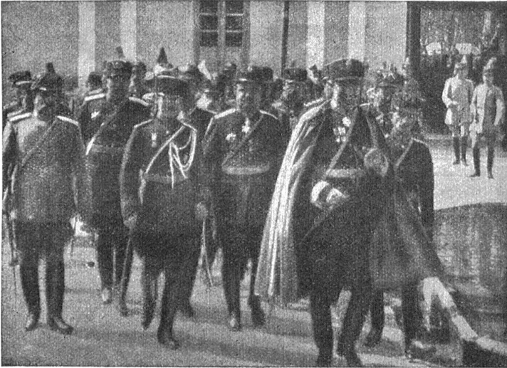
Riza Khan mit seinem Stab. (Mittliche aus Mittelholzer „Persienflug“.)

land, auch wenn es Polen oder Rumänien angreifen wird, zu hintertreiben.