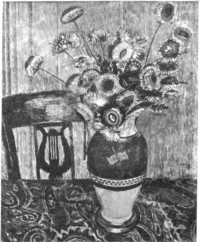
h. Soreffier: Immortellen.

Sie schien sich auf etwas zu besinnen und stand auf. „Jetzt mußt du aber doch unseren Stall ansehen! Ich habe extra deswegen das Licht brennen lassen!“ Sie holte die blankgeputzte Laterne aus der Küche und geleitete den ihr mit gemischten Gefühlen folgenden Gast durch eine Seitentür aus dem Hausgang in die Tenne hinaus, wo unter den Futterladen das duftende Heu für den Morgen