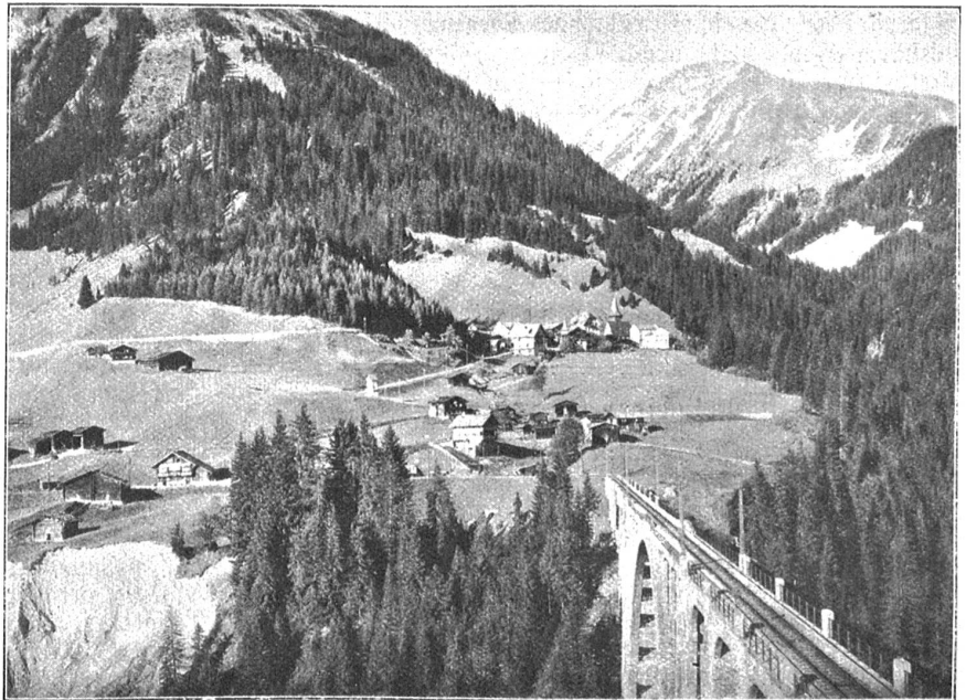
Langwies mit Viadukt.

das Tal und gewährt einen freien Ausblick über saftiggrüne Matten in die einfachen, aber lieblich gelegenen Bergdörferchen des Schanfigg, von denen Tschierschen in besonders beneidenswerter Lage auf einer sonniggrünen Terrasse gebettet ist. Wild zerklüftete Seitentäler, dazwischen wieder tief dunkle Tannenwäldchen, lassen uns immer wieder neue Naturschönheiten entdecken. Brausende Wasserfälle zerstäuben ihre Wässer in Billionen glitzernder und schillernder Perlen. Wie schön und stimmungsvoll sind auch die Stationsgebäude in schlichtem Heimatschutzstil der Umgebung angepaßt. Mit ihren sinnvollen Sprüchen stehen sie vielleicht einzig da, erhalten aber so ein poetisches Cachet, das ganz der romantischen Gegend angepaßt ist. „Es eilt die Zeit, Mensch sei bereit“, „Wo ein Wille, ist auch ein Weg“, diese und andere Lebenswahrheiten werden dir in Erinnerung gerufen. Man könnte fast von einer ambulanten Bergpredigt sprechen. Diese Sprüche zeigen uns aber auch, mit welchem Ernst die Leiter des großangelegten Unternehmens an die Arbeit gegangen sind, wie sie, allen Schwierigkeiten zum Trotz, unermüdet an der Arbeit waren, bis das große Werk vollendet und der erste Zug stolz und siegesbewußt in den Talkessel von Arosa einfahren konnte. Der Spruch „Wo