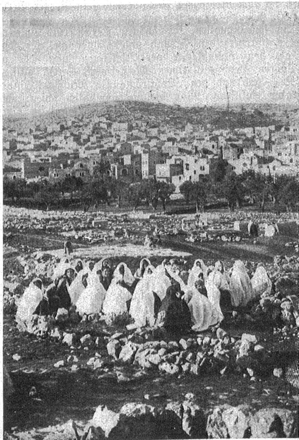
Araberinnen, die aus der Umgebung Bethlehems zum Weihnachtsfeste in die Stadt kommen, erwarten singend und plaudernd den Eintritt der „großen Nacht“.

Da die eingeborenen Christen zum größten Teil dem griechisch-orthodoxen Glauben angehören, traten früher die Weihnachtsfeierlichkeiten nach dem julianischen Kalender mehr