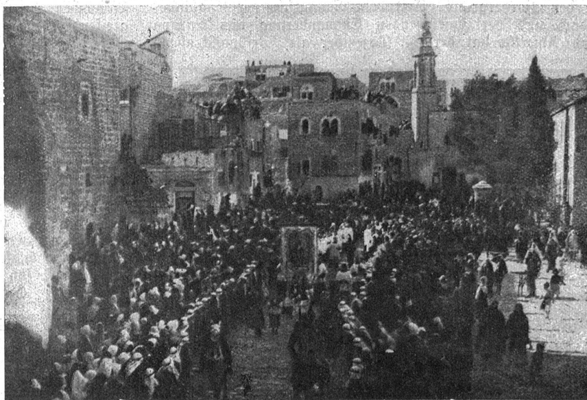
Die große katholische Weihnachtsprozession in Bethlehem. Auffallend groß ist die Teilnahme der Araber.

Früher einmal, als noch die felsige Rhede von Saffa