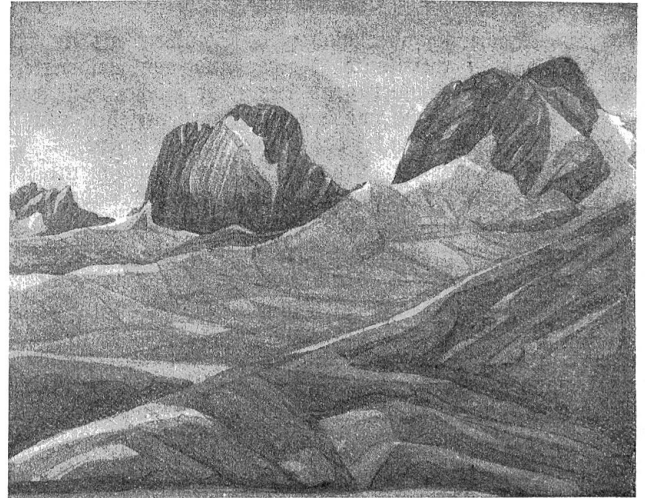
Walter Krebs: Winter im Gantrifftgebiet.

eine nicht gewöhnliche Befähigung zur künstlerischen Abstraktion. Walter Krebs versteht es, der Landschaft eine Seele zu geben, ohne die Natur zu vergewaltigen, ohne abstoßende eigenwillige Züge hineinzubringen. Auch zeigen sie einen erstaunlich sicheren koloristischen Geschmack. Man merkt, daß er die Palette intuitiv handhabt auf Grundlage eines guten handwerklichen Könnens. Aber gerade dieses Herkommen aus dem Malerhandwerk schließt für ihn die Gefahr der Schablone und des Rezeptes ein: man weiß, wie es gemacht wird und darum kann man es auch.