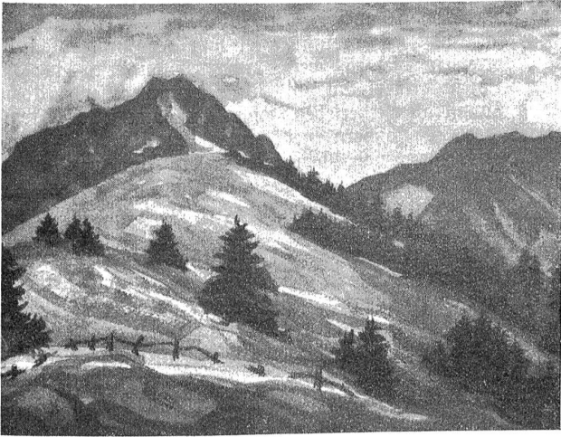
Walter Krebs: Im Schwefelberg.

Ungnade aber nicht stark anzufechten; er redete unbefangen, manchmal geradewegs feß, drauflos und hielt den Blicken stand, ohne mit einer Wimper zu zuden. „Ich sage nicht