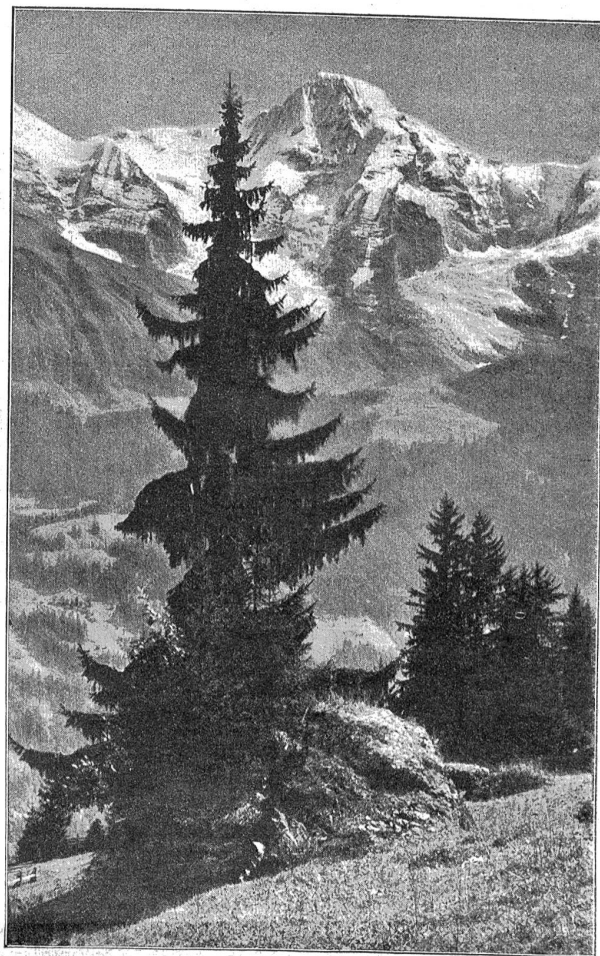
Der Mönch von Mürren aus.