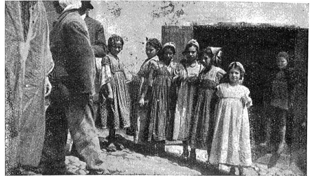
Arabische Mädchen in einer engen Straße in Constantine.

dient dem Heilung suchenden Kurgast als Aufenthalt; schade nur, daß der Zug nicht anhält, damit man das Wunder besichtigen kann, was gewiß eine gute Reklame wäre.