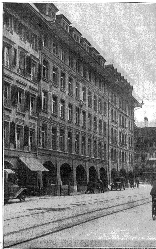
Das neuerstehende Bern. Das Karl Schenk-Haus an der Spitalgasse, welches an der Stelle der abgerissenen Häuser Nr. 6-12 erbaut wurde.

Das Karl Schenk-Haus und das ebenfalls neu erstellte Hinterhaus an der Neuengasse bildet mit seiner ins Kleinste ausstudierten Raumausnutzung, seinen modern-