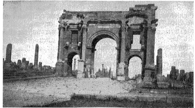
Kaiser Trajans Siegestor im alten Cimlad.

dürfnisanstalt. Am Rande der Stadt, in einem seither zum Schutze desselben erstellten Häuschen befindet sich ein wahres Kunstwerk in farbigem Mosaik, ein byzantinisches Taufbecken, drei Stufen tief und nahe dabei der christliche Friedhof mit unterirdischer Katakombenkapelle. Im Museum beim Eingang zur Stadt bleibt das Auge des Besuchers wie gebannt haften auf den wunderbaren Mosaiken ehemaliger Wöden römischer Villen, in einer Farbenpracht und Zusammensetzung, die heute kaum noch möglich wäre; sowohl Figuren, wie Landschaften und Jagdbilder scheinen auf einige Meter Distanz wie frisch gemalt. Lebensgroße Figuren in Marmor sind meist beschädigt, aber zeugen von der bis heute nicht übertriffenen Kunst damaliger Bildhauer. Alte Münzen und Schmuckgegenstände feinsten Arbeit vervollständigen die wertvolle Sammlung, die die hohe Kultur der damaligen Zeit der heutigen Generation vor Augen führt. Ein kleines, gut geführtes Hotel bietet dem Besucher saubere Unterkunft und nicht zu teure Bewirtung; aber auch hier muß man sich vor dem gewerblichen Schwindel in acht nehmen, indem dem Besucher Steine aus alten römischen Ringen zu 20–30 Franken angeboten werden, die nicht eine Minute in den Trümmern gelegen haben und zu 50 Cts. überall käuflich sind. Das Zuchthaus in Ambeze ist sehr sauber und human eingerichtet, es sollen Körperstrafen nur bei ganz renitenten Sündern angewendet werden.