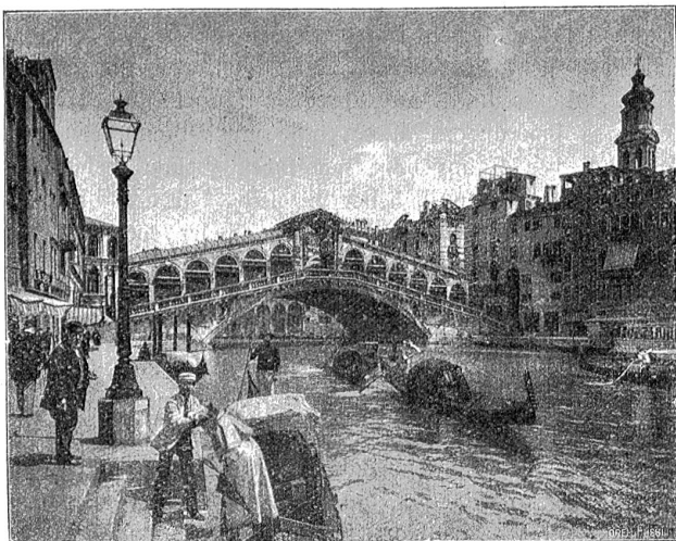
Venedig. — Ponte di Rialto.

Die Bücher nennen Benedig eine Märchenstadt. Maler, Dichter und Musiker waren dort, Dürer, Feuerbach und Richard Wagner, und aus ihren Briefen kann man lesen, einen wie mächtigen Eindruck diese Zauberstadt auf sie gemacht hat. Sven Hedin, der große Reisende, rät: „Wer zum ersten Male Italien besucht, sollte stets mit Benedig, der Heimat Marco Polos, beginnen, und zwar muß er es so einrichten, daß er am Abend dort anlangt. Dann wird sich eine Wunderwelt vor ihm erschließen und er wird glauben, in ein Märchen aus „Tausend und eine Nacht“ versetzt zu sein.“