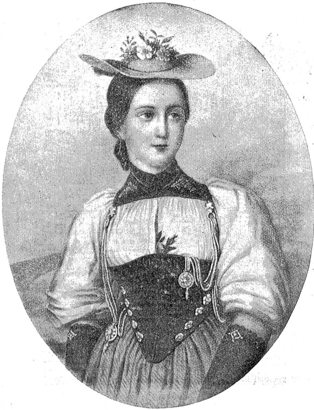
Brienzermittelschl in der Bernertracht (1825).

Neuenburg, Solothurn, Graubünden und Tessin vertreten sein, in geschlossenen Einheiten. Es wird seinen Charakter als ein Bernerfest behalten, mit einem erfreulichen eidgenössischen Einschlag, wie es sich für Bern gehört.