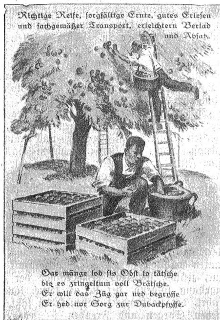
Richtige Reife, sorgfältige Ernte, gutes Erlesen und fachgemäßer Transport, erleichterten Verlad und Absatz.

sortiment und ein Zwergobstsortiment — wie als Augenweide. Dann sehen wir uns vordemonstriert die verschiedenen Verpackungsmethoden, die Einrichtungen des Obst-