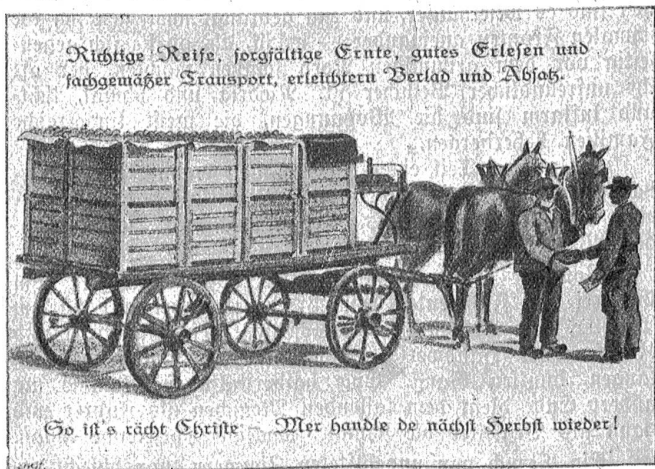
Richtige Reife, sorgfältige Ernte, gutes Erlesen und fachgemäßer Transport, erleichterten Verlad und Absatz.

Wie so anders das Erwachen des Tages hier in den Bergen, als drunten im Tiefland, am südlichen Meer. Wäh-