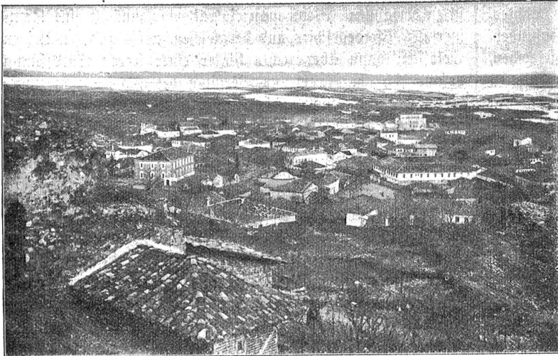
Albanien. Totalansicht der Hauptstadt Durazzo.