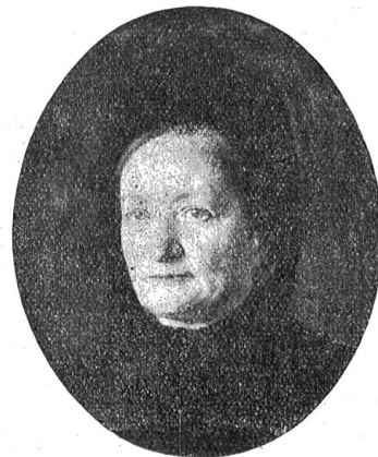
Bildnis der Mutter des Künstlers.