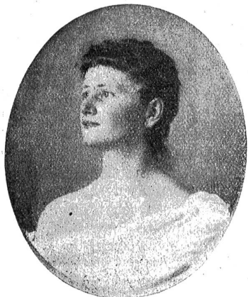
Bildnis der Schwester des Künstlers.