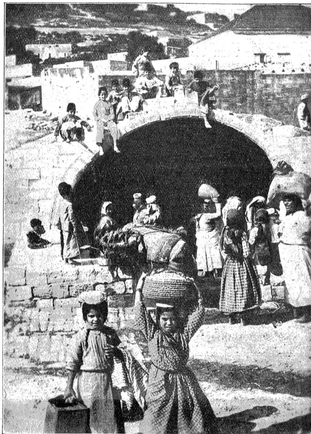
Am Brunnen der Jungfrau in Nazareth. Frauen und Mädchen schöpfen am Weihnachtstage das Wasser, das als glück- und segensbringend gilt.

öffnet und hinein strömt eine Fröhlichkeit, eine Zuversicht ohnegleichen. Die wahre Weihnacht ist in ihrem Hause angebrochen.