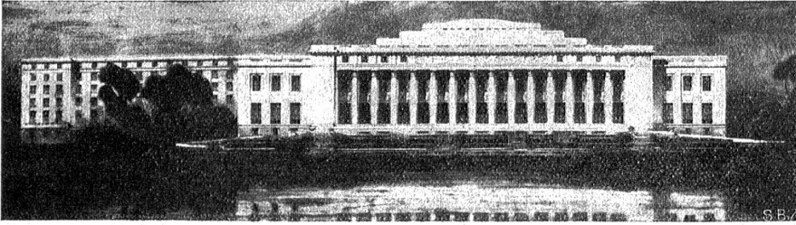
Dieser Entwurf für den Völkerbundspalast in Genf von den Architekten Renot und Flegenheimer soll als Grundlage für die Ausführung dienen.