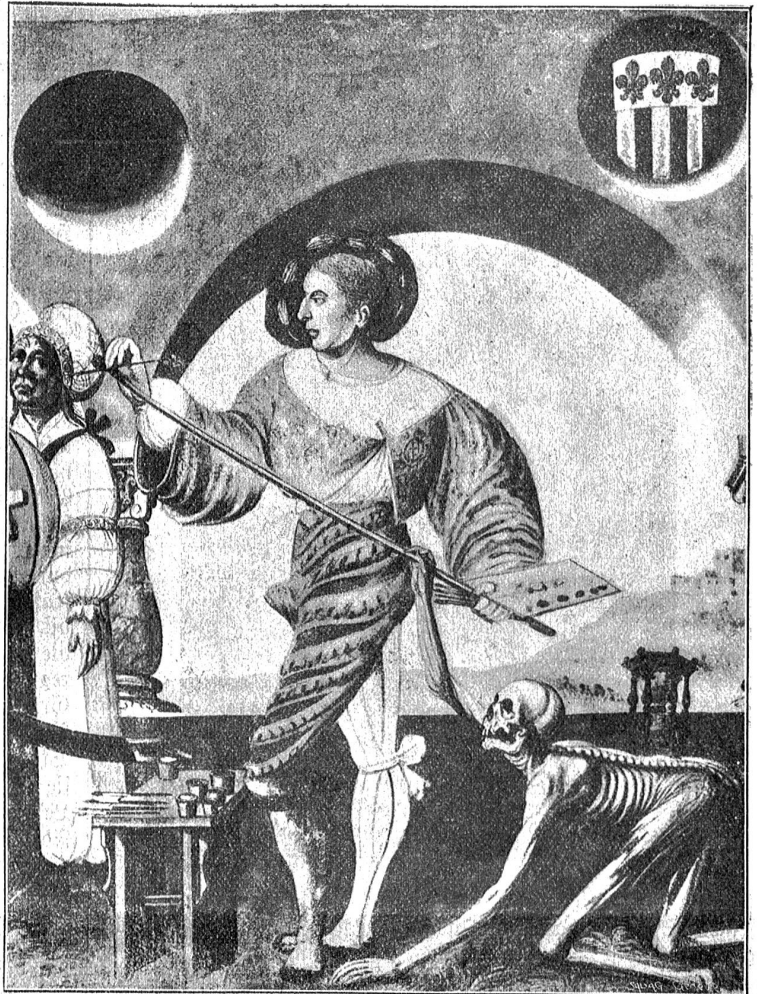
Niklaus Manuel als Maler der Totentanzbilder und Verfasser der saftnachtspiele an der Kreuzgasse, ein einflußreicher Verfechter der Reformation.

„Erzähl' mir von meinem Vater“, bat Rahel eines Tages. „Ich habe doch einen Vater gehabt?“ Ottilie erzählte, und das Bild, das sie vor dem Kinde erstehen ließ,