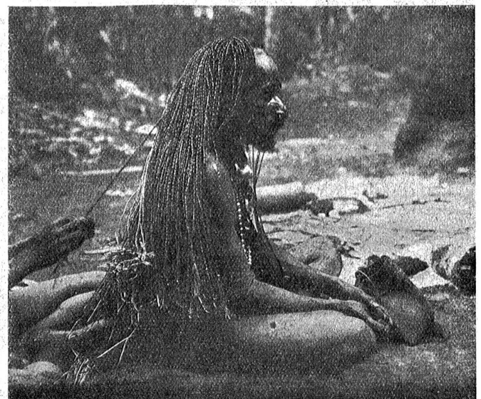
Bei den Papuas. Stelchen der haarverlängerungen in Saguée.

Nirgends war in den aus Sagoblattrippen gefertigten Wänden eine Oeffnung zu sehen, doch reichten diese auf allen vier Seiten nicht ganz bis zum Boden herab. Unter ihnen mußte man durchkriechen, um ins Innere zu gelangen,