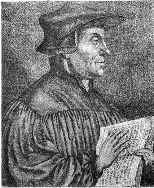
M. HULDRICUS ZWINGLIUS REFORMATOR ET PASTOR ECCLESIAE TIGURINAE. Aetatis 48. Obiit die 21 octob. Aetatis 48. Dum Patria quiesceret per dogmata sancta fatissem. Ingrato Patria celsus ob emte celo.

Scheu, der Zucht und Sitte loderten sich. In hohlem Prunk erglänzte das falsche Söldnerglück und verführte den großen