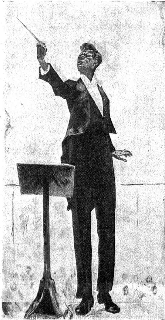
Cuno Amiet: Der Dirigent (1919).

veranstalteten Studienreise durch Ägypten und Nubien. Auf Grund und in Fortsetzung eines anlässlich der 41. Hauptversammlung im Schoße des Verschönerungsvereins der Stadt Bern und Umgebung, am 28. Februar abhin, über diese Reise gehaltenen Lichtbildervortrages, sei gestattet, an dieser Stelle auf die Reiseschilderung zurückzukommen, und zwar unter besonderer Berücksichtigung der Nilfahrt durch Unternubien.