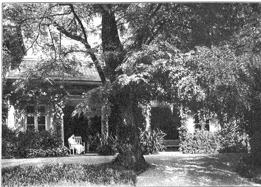
Landhaus Märchligen. — Peristyl.

„Aber nicht nur Auswendiges, auch wenn... wenn... — „Du dich verliebst, willst du sagen.“ — „Ja, das ge-