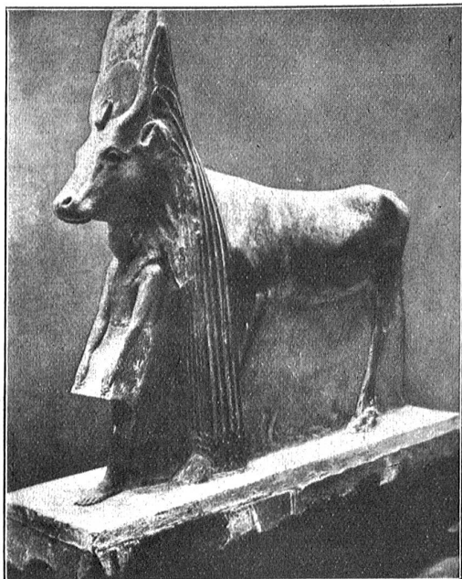
Hathor als Kuh.

Diese Anspielung auf tierische Züge im Gesicht mancher Menschen beliebt man aber nicht etwa so aufzufassen, wie