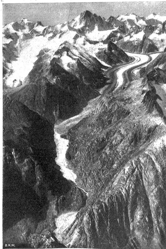
Siegerbild auf Oberaargletscher (links), Unteraargletscher (rechts) und Aarboden (Mitte), der unter Wasser kommt. Ganz unten Logierhaus auf Rollen.

Der Grimselsee von 100 Millionen Kubikmeter nutzbarem Wasserinhalt entsteht durch die Abriegelung der Aare in der Spitalamm und auf der Seeuferegg durch zwei große Sperren und wird sich bei einem Höchsttau auf Höhe 1912 vom unteren Ende des Unteraargletschers rund 5,5 Kilometer nach Osten bis über die heutigen Grimselseen hinaus erstrecken. Sein Untergrund ist vom Gletscher der Eiszeit ausgeschliffener, wasserdichter Granitboden, der in Jahrtausende langer Arbeit mit Gletscherschutt und Sand über-