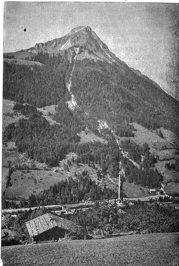
Der Niesen von Mählenen aus mit der elektrischen Drahtseilbahn.