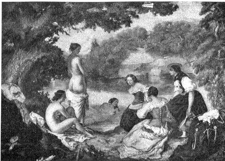
Frank Buchser-Ausstellung in der Kunsthalle Bern: „Leonore im Bade“.

Es kam wie es mußte. Schwer genug, schwer, schwer genug. Mein Vater ließ mich nicht zurückholen, wie ich fürchtete. Doch ließ er mich ohne Mittel. Mit dem letzten Rest meines ersparten Geldes bin ich in die Fremde gegangen, als Erzieherin. Ich traf es gut. Ein vornehmes