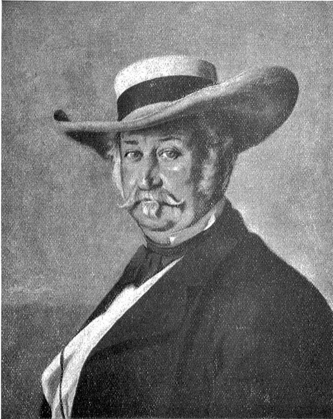
Frank Buchser-Ausstellung in der Kunsthalle Bern: Porträt des Generals Sutter.

Spornen zur Arbeit und notwendiger Entwicklung, Freude aneinander, starke unwandelbare Liebe, die durch das, was wir um sie zu leiden hatten, langsam sich zu klarem und unverwundbarem Kristall umformte, den nichts angreifen und trüben konnte. Nie wankten wir. Nie wünschten wir uns zu trennen, denn wir waren frei. Wir scheuten uns, auch nur leise an die Selbständigkeit des andern zu rühren. Jedes war ein Ganzes für sich, und dennoch jedes des andern Ergänzung. Darum kamen wir täglich mit Freude neu zusammen.