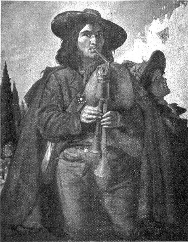
Srank Buchjer-Ausstellung in der Kunsthalle Bern: „Pifferari“.

etwas Gutes. — Das haben beide Künstler, Buchjer und Amiet, gemein: Sie lauschten auf die innere Stimme und haßten die Kompromisse. A. H.