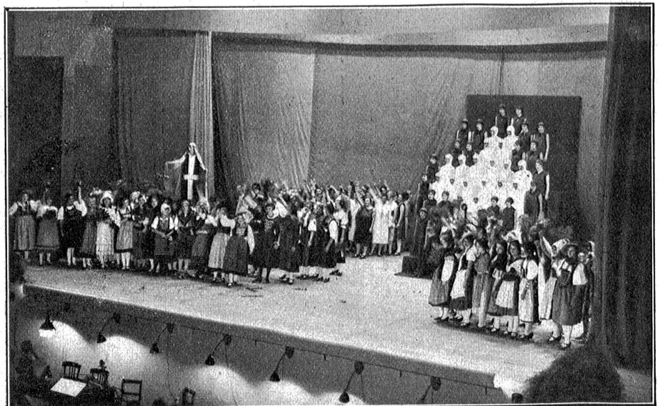
Eröffnungsspiel im Seft- und Kongress-Saal der „Saffa“.

Wir sparen uns die drei Hallen Amateurarbeiten, Wissenschaft und Literatur für einen zweiten Besuch auf und begeben uns direkt hin zu der Gruppe Landwirtschaft und Gartenbau im Hintergrund des Ausstellungsparkes. Hier bei den Gärtnerinnen und Bäuerinnen, bei ihren herrlichen Blumen, ihren prächtigen Gemüsen, ihren Darstellungen der besten Methoden