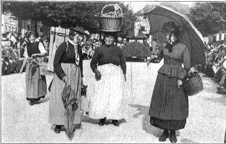
Aus dem „Saffa“-Seftzug: Küttiger Marktfrauen.