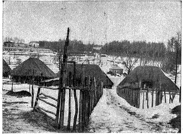
Herrenhaus und Wirtschaftsgebäude in Jasnaja Poljana.

hinter den großen und größten Werken der Weltliteratur, „Krieg und Frieden“, „Anna Karenina“, „Die Auferstehung“, „Die Kreutzerfonate“. Hier erörterte Tolstoi jene schweren Probleme, denen man so gerne aus dem Wege geht. Sie