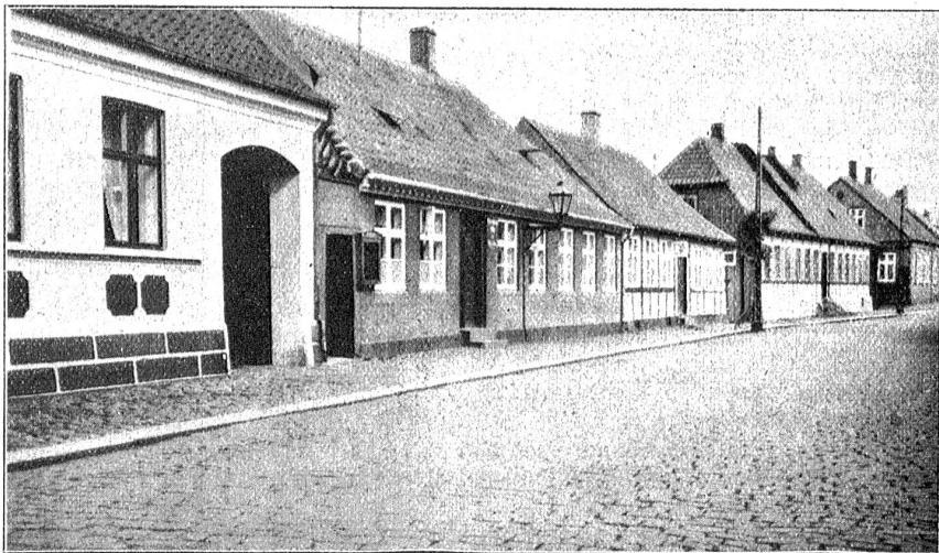
Bornholm. Straße in Rönne.

Die Bevölkerung fühlt sich unter dänischer Verwaltung recht wohl, und ihr verdankt sie ihre heutige Kultur und ihren Wohlstand. Verwaltung, Gerichtsbarkeit, Post und dergleichen sind rein dänisch, auch die Schriftsprache ist dänisch, die Umgangssprache der Bevölkerung ist jedoch ein dänischer Dialekt, der für fremde Ohren nicht leicht verständlich ist.