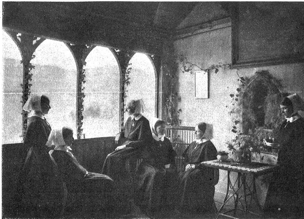
Schloß Wildenstein. Das sogenannte „Wildkirchli“.

Noch ist ein ganzer Schloßflügel unausgebaut und ungenützt; in seinem hohen leeren Turme haust die Nachtule. Auch sie wird den ihr von einer überlebten Zeit als Erbe