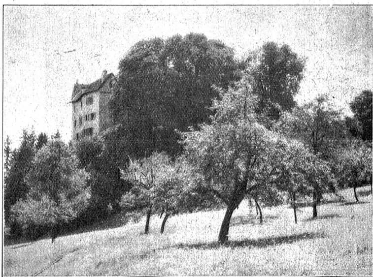
Schloß Wildenstein. Von der Nordseite gesehen.

So ist ein historisch interessantes Objekt nach wechselvollem Schicksal in die Hand eines Besitzers gelangt, der wohl instande ist, die hier durch Jahrhunderte auf die Gegenwart hinüber geretteten idealen Werte zum Segen gegenwärtiger und künftiger Geschlechter wieder aufblühen zu lassen. Das Berner Diakonissenhaus verfügt mit seinen 778 Schwestern und seiner zielbewußten Leitung über ge-