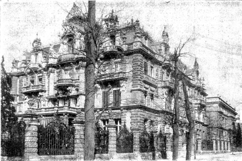
Architektur gegen Ende des vorigen Jahrhunderts.

dem kindlichen Gedankenkreis geübt werden. Ganze Häuserreihen mit ihrem Auf und Ab der Dächer läßt das Kind auf seiner Schiefertafel oder auf dem Zeichnungsblatt erstehen, das Gesicht des Mondes oder eine Köhlipliefahrt muß herhalten zum Ueben der Bogen. Und kommen nachher die Buchstaben an die Reihe, so steht das Kind vor keinen zu großen Schwierigkeiten; denn die Elemente brauchen bloß zusammengefügt zu werden, und die Kerle stehen da in ihrer unbeugbaren Eindeutigkeit.