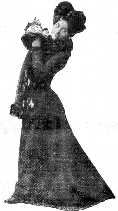
Mode gegen Ende des vorigen Jahrhunderts.