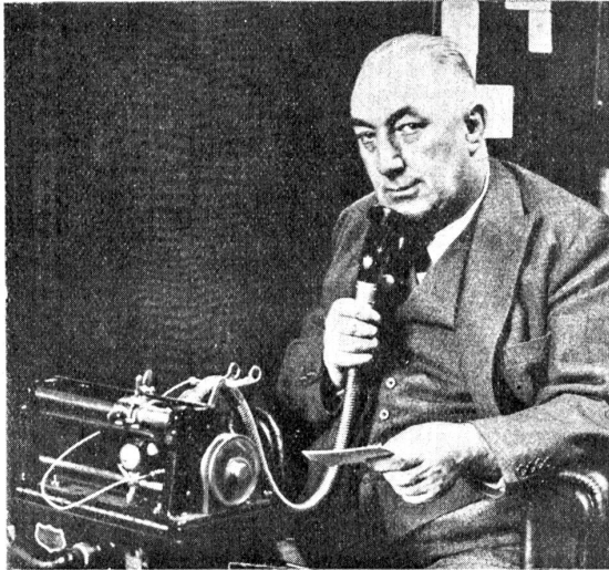
Edgar Wallace am Diktaphon.

beitsamen Menschen das höchstmögliche Lob. Edgar Wallace, eines Arbeiters Kind, hat kaum richtig die Volksschule besucht, mit elf Jahren war er angewiesen, seinen Lebensunterhalt selbst zu verdienen, er wurde Zeitungsverkäufer. Der kleine Knirps lernte bald einsehen, daß man damit nur in Amerika Reichtümer gewinnen könnte, und er ging, um sich wenigstens satt essen zu können, zu einem Koch