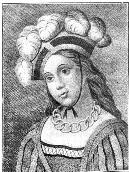
Porträt Jeanne d'Arc.

Am 17. Juli 1429 ging die Krönung vor sich. Johanna hielt während der Feierlichkeit mit ihrer Fahne an der Seite des Königs und begrüßte ihn als erste.