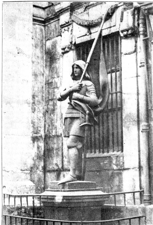
Die Jeanne d'Arc-Statue in Paris.

nicht eher ruhen, als bis der letzte Engländer den französischen Boden verlassen hatte. Sofort ging's nun auf Paris los, das ebenfalls den Engländern gehörte. Inzwischen war in der Normandie eine Erhebung für Karl VII. entstanden,