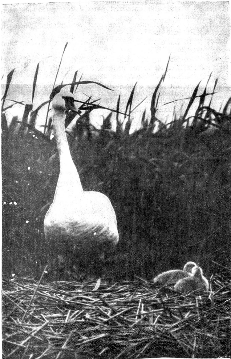
Eine stolze Muttergans.

Hart ist aber auch der Kampf ums Dasein in der Tierwelt. Ergreifend sind die Schilderungen Bengt Bergs von der diebischen Krähe, die die Nester der Kleinvögel plündert oder in einem