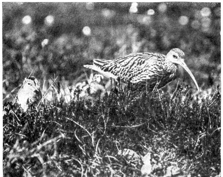
„Wenn Mutter geht, um das letzte Junge auszubüßen, gucken die Jungen über den Rasttrand.“