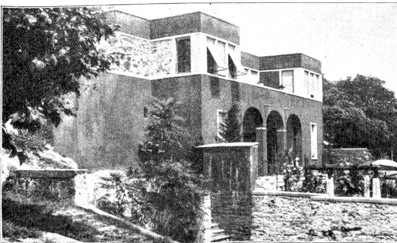
Neuzeitliche Bauten in Ascona. Villa Dr. Guhl.

In diesem Augenblick knackt der Auslöser des Photoapparates, den ein hummelnder Tourist vor den waschenden Frauen eingestellt hatte. Mutwillig haben die jungen Mädchen ihre Locken aus den brennenden Stirnen geschüttelt und das verkehrungsvollste Lächeln aufgesetzt, wie sie den Mann mit dem Kasten kommen sahen. Sie kennen das, fast alle Tage werden sie photographiert und es gefällt ihnen nicht übel,