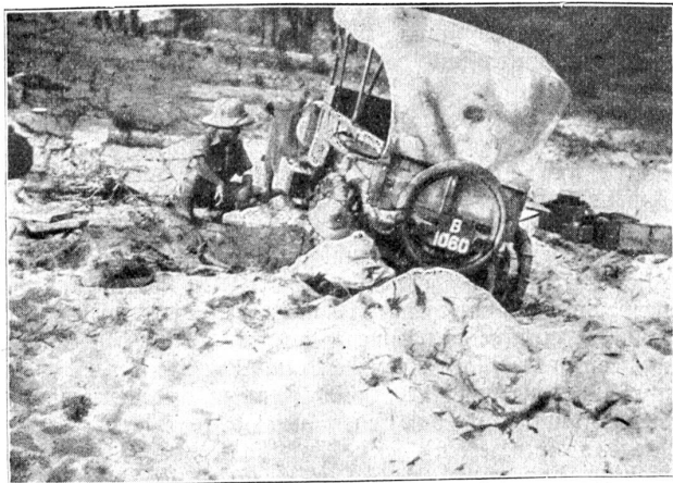
„Schließlich gelangten wir zur Einsicht, daß wir uns ins Unabänderliche fügen mußten . . .“

Bilder zu erlangen, oder auch, um einen Vorwand zum Schießen herbeizuführen. Die Befürworter dieser Ansicht verzeihen den Wert der Naturkunden, die überdies noch wesentlich für die neue Heimat wirken. Ich konnte mir keinen