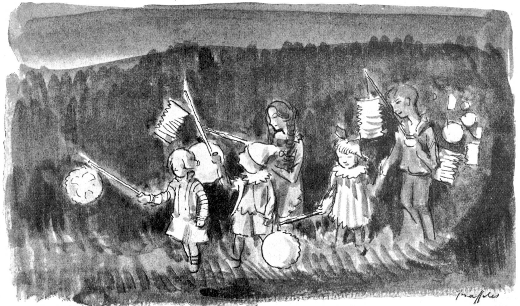
Augustfeier im Turbachtal.

(Nach einer Zeichnung von F. Traffelet.)