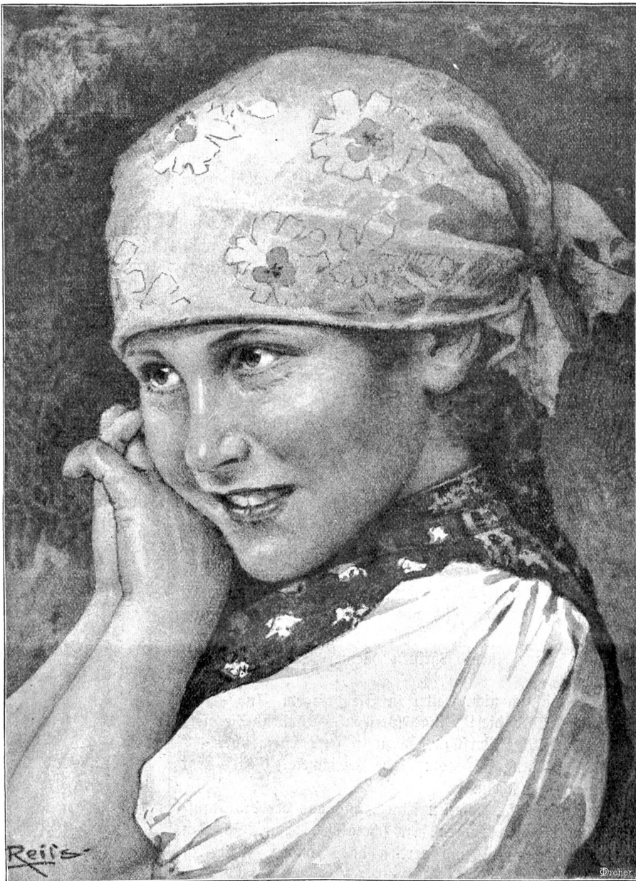
S' Rösl. — Nach einer Zeichnung von Sris Reiß.

„Nun noch die infame andere Geschichte. Lieber Pastor, ich könnte die Sache ja einfach dadurch aus der Welt schaffen, daß ich Frau Nautilus das in dem Böschungsvertrag festgelegte Vermögen glatt vergütete. Aber ein blanker