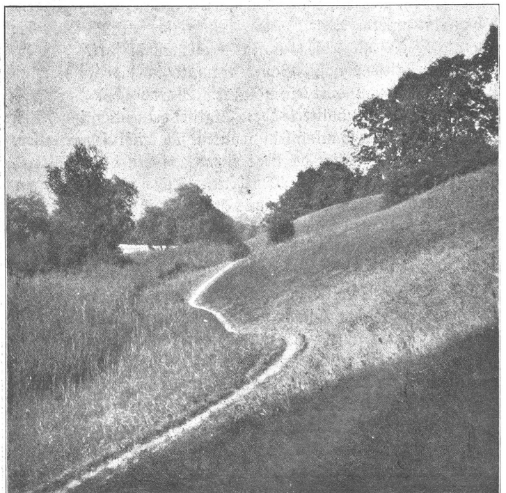
Abbild. 2. Uferweg-Partie zwischen Muri-Bad und Muri-Sähe.

Glücklicherweise also ist diese Gegend gerade den Bernern genug bekannt, als daß es nötig wäre, ihre Schönheiten mit ach! so unzulänglichen Worten schildern zu wollen. Auch die hier gezeigten Bilder vermöchten für sich allein nicht entfernt einen Begriff zu geben von den unerschöpflichen Reizen jener Landschaft. Denn sie ist vor allem auch als Ganzes schön, im Zusammenwirken von Nähe und Ferne, als lieblichstes Idyll im Rahmen der großen Linien der Aare und der Berge voll schönen Schwunges, im Reichtum und in der Frische einer urwüchsigten, fast wilden Vegetation mit prachtvollen Durchblicken auf Fluß und Alpen — ein Zauber, dem mit der Kamera fast gar nicht beizukommen ist. Und wer ihn noch nicht gespürt hat, der möge nicht mehr zögern, diese Gefilde aufzusuchen. Jedem Naturfreund, der einmal ihre Reize kennen gelernt hat, bleiben diese Gegenden lieb und teuer. Seien es die wundervollen Schilfwiesen, die sich unterhalb des Märchligengutes hinziehen, die in märchenhafter Verträumtheit ruhenden Seerosenteiche bei Allmendingen oder die prachtvoll ernst, überraschend alpin anmutenden Ufer bei Rubigen, Riesen und