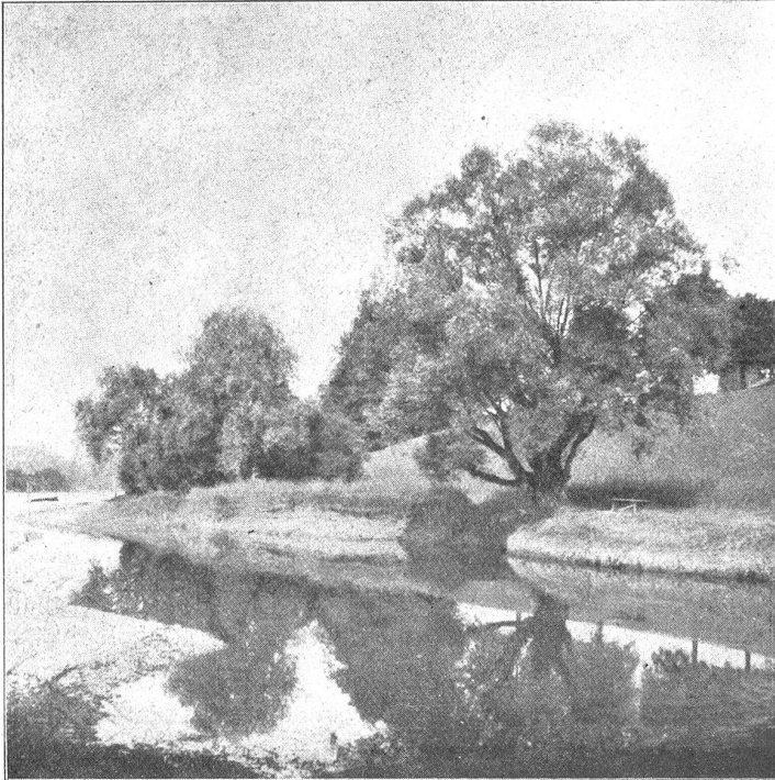
Abbild. 1. Das Idyll von „Muri-Bad“ mit seinen alten Weiden von selten schönem Wuchs. Hier sollte die geplante Auto-Uferstraße beginnen!

„So, du Bagabundin, mußt du auch noch hier herum-schnüffeln; ist das der Dank dafür, daß dich der Pfarrer angenommen und aufgehirtet hat, daß du ihm alles ver-