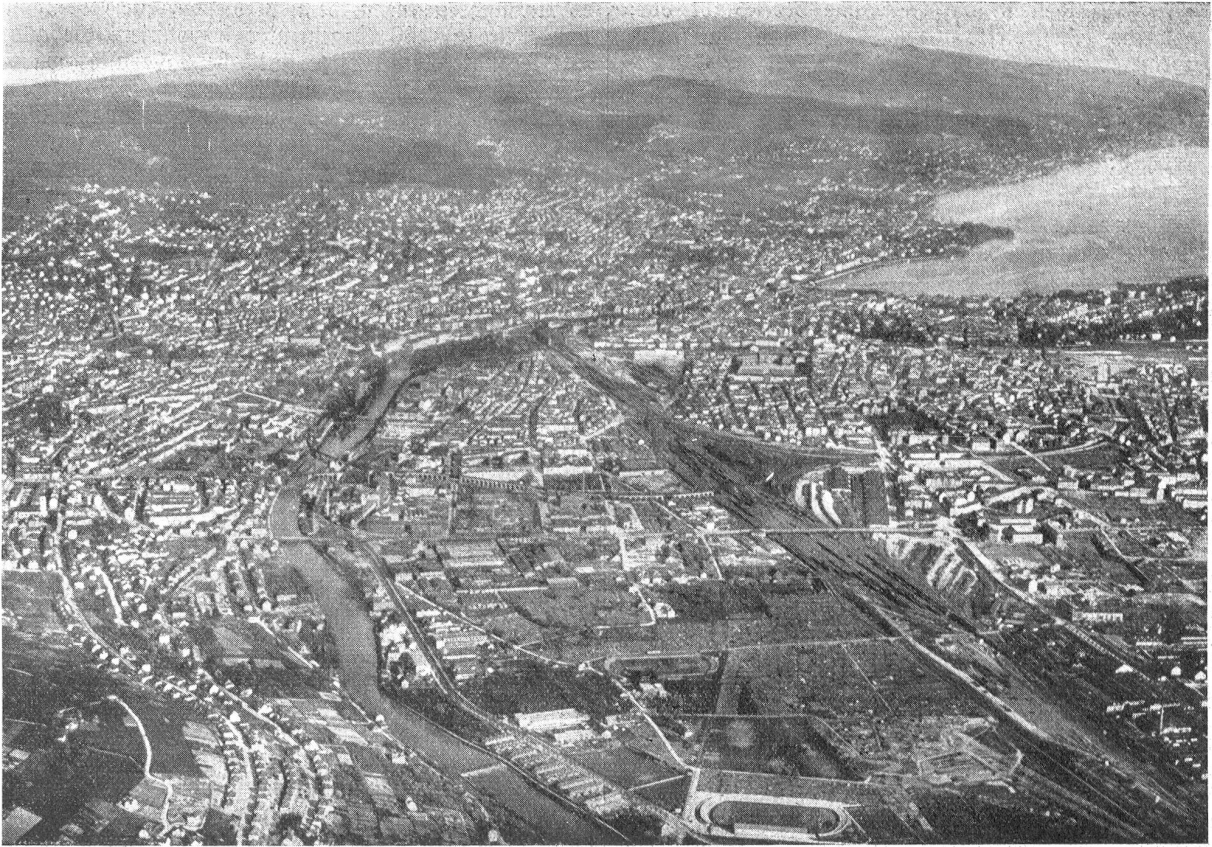
Zürich, die größte Schweizerstadt. Aufnahme der Ad Astra aus 1500 Meter Höhe. Blickrichtung Südosten.

Die Altstadt (in der Gegend des zweitürmigen Grossmünsters) verschwindet im Häusermeer der Neustadt, das ein breites Flußtal füllt, an die Abhänge des Zürichberges hinaufbrandet und auf beiden Seeufern verehbt. In der Talmitte, hart an der Altstadt, münden die Bahnlinsen in einen Kopfbahnhof. Die ausgedehnten Eisenbahnanlagen verlangen gebieterisch noch mehr Raum, und mit Millionenaufwand werden die Geleise verschoben und gehoben, um damit rechtzeitig den Notwendigkeiten einer noch anspruchsvolleren Zukunft gerecht zu werden. Zürich hat zirka 225,000 Einwohner.